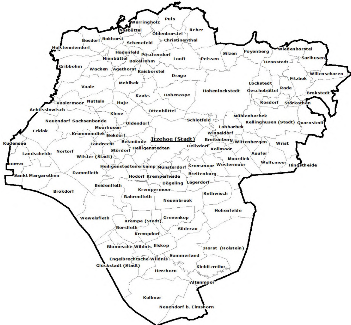
© GeoBasis-DE/LVermGeo SH 2013 ATKISà Basis DLM